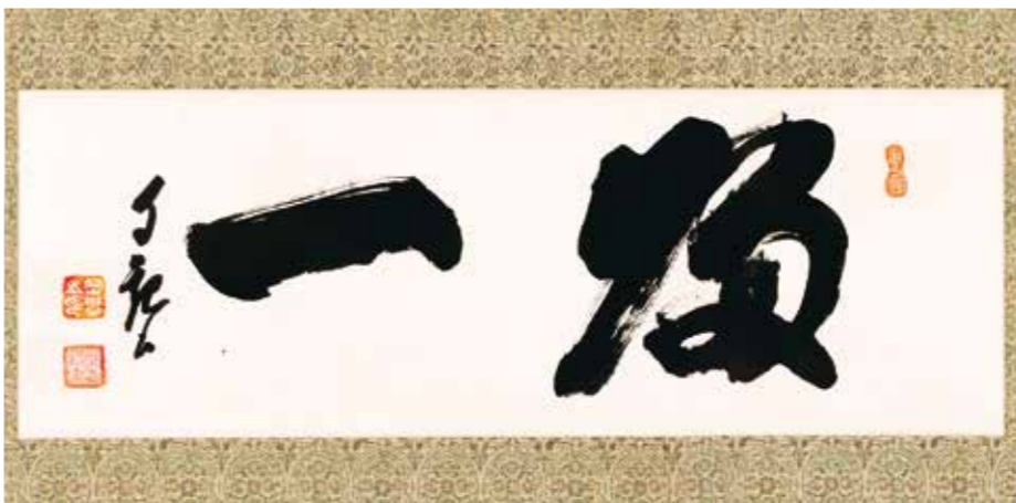
明主様御書「一」(昭和20年代) 落款：自観書 引首印：光明 落款印：岡懋之印 東山莊主

以上に基づき、今後の世界救世教には「教主」を置かず、一人ひとりが明主様に真向かい、理想世界実現に邁進することとした。